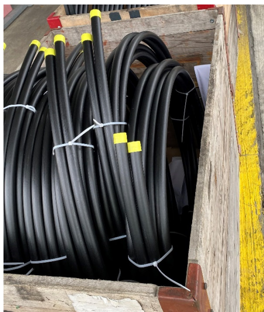
Verpackung und Anlieferung der Energiepfähle

26 GEROtherm ® Energiepfähle aus PE 100RC 25x2.3mm, PN 16